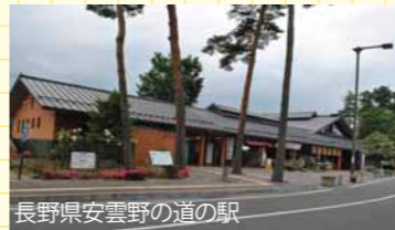
長野県安曇野の道の駅

になるのです。04年の新潟中越地震を契機にその機能が発揮されるようになり、現在では国土交通省の支援を受けて緊急時の避難地区の役割を果たしています。